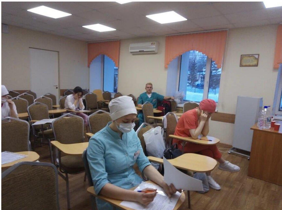
Участники готовятся к выполнению конкурсных заданий.