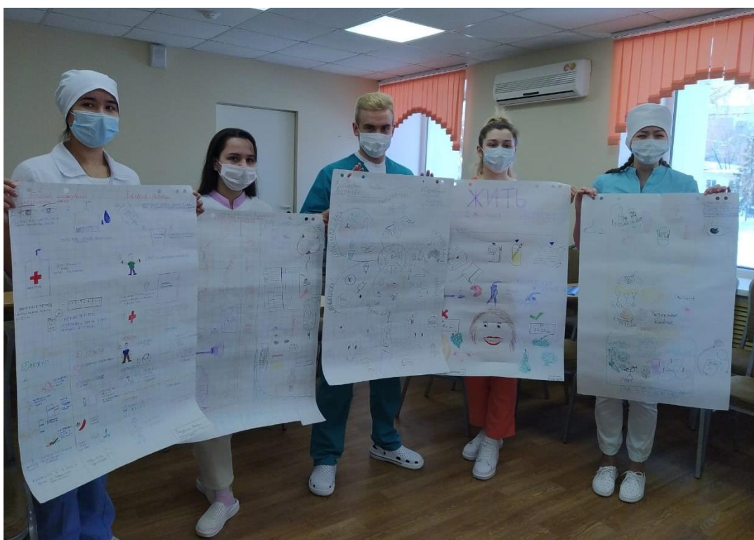
11 февраля 2021 г. Соревнования завершены. Участники демонстрируют постеры, подготовленные для пациента с сахарным диабетом и почечной недостаточностью.